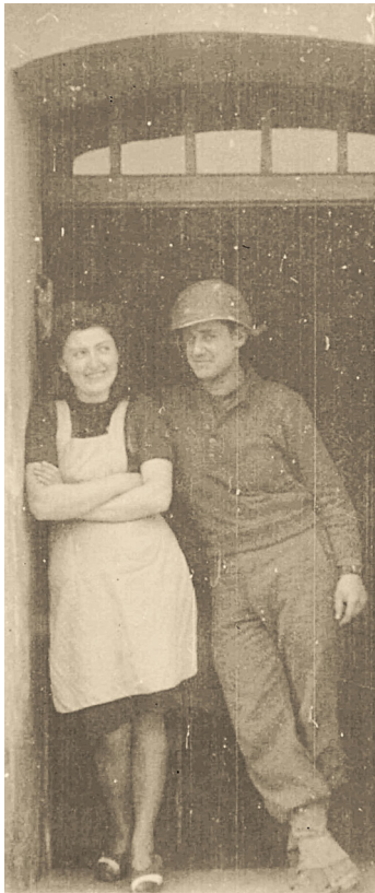
Boffzener „Fräulein“ mit amerikanischem GI. Nicht für alle waren die Kontakte derart harmonisch.