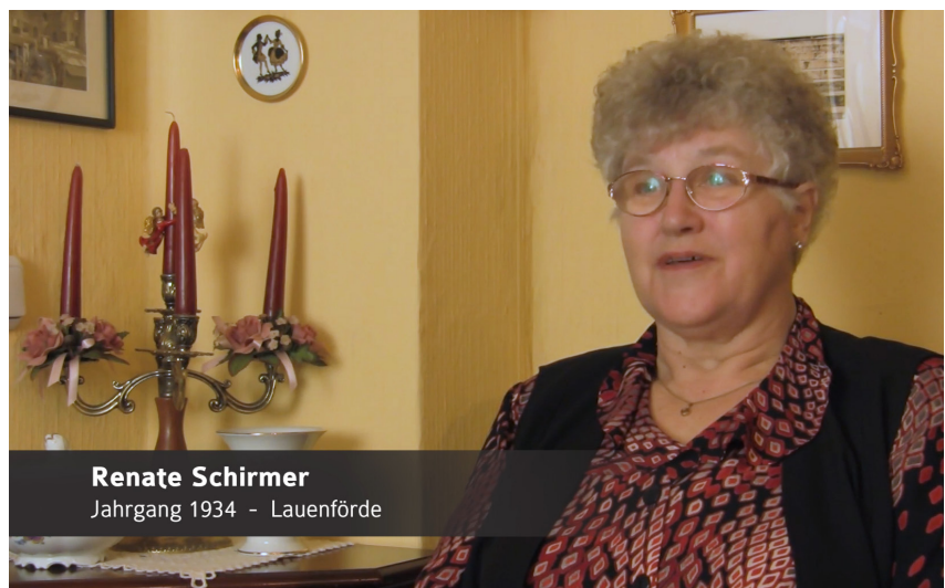
Zeitzeugin im Film

Die Zahl der Personen, die aus eigener Anschauung über die Zeit des Nationalsozialismus und des Zweiten Weltkrieges berichten können, nimmt jedoch stetig ab. Aus diesem Grund haben sich insbesondere in den vergangenen zwei Jahrzehnten unterschiedliche Projekte um die Konservierung der Erinnerungen von Zeitzeug:innen bemüht. Eines der prominentesten Beispiele ist wohl der Jahrhundertbus, in dem bundesweit Interviews aufgezeichnet wurden. 8 In der jüngeren Vergangenheit wird zudem intensiv über das Ende der Zeitzeugenschaft 9 und seine Bedeutung für unsere Erinnerungskultur diskutiert.