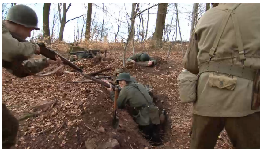
Der Film liegt in zwei Versionen vor: Mit nachgestellter Gefechtszene (44:57 Min.) und ohne (42:28 Min.).

Ergänzend zu den Modulen für den Geschichtsunterricht wurden einige allgemeine Reflexionsfragen für den Einsatz im Politik- oder Philosophie-/ Ethikunterricht zusammengestellt.