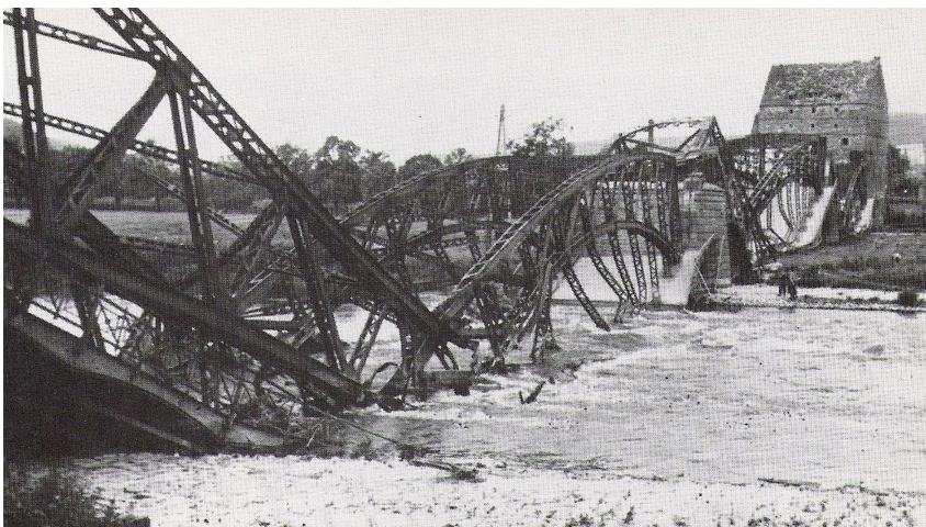
Krieg vor der eigenen Haustür: Am 7. April 1945 werden sämtliche Weserbrücken in der Region trotz starker Proteste der Bevölkerung gesprengt.

Bereits die Urfassung der Dokumentation wurde in unterschiedlichen Schulkontexten eingesetzt. Dabei haben sich in der Reflexion mit den Lernenden insbesondere die lokalen Bezüge und die authentischen („spannenden“) Erzählungen der Zeitzeug:innen als erfolgskritisch für die Auseinandersetzung mit der Thematik gezeigt.