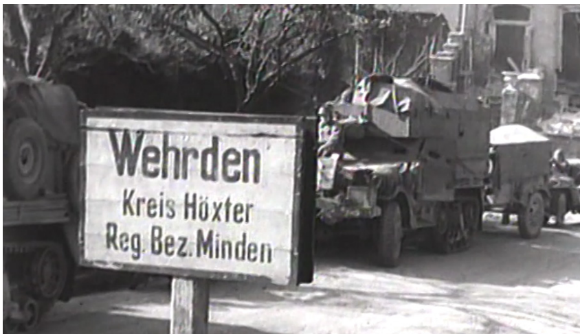
Ausschnitt aus dem amerikanischen Archivmaterial: Wehrdener Ortsschild mit amerikanischem Kriegsmaterial.

Das Potenzial von Zeitzeug:innen für den Geschichtsunterricht ist jedoch nicht ausschließlich auf ihre Authentizität 14 zurückzuführen. Insbesondere der regionale Fokus der Dokumentation führt die Schüler:innen näher an das Thema heran und schafft lebensweltliche Verbindungen. Zentral wird dabei die Frage, wie lokale Geschehnisse und deren Konstruktionen durch die Erzählenden mit überregionalen Strukturen zusammenhängen. 15