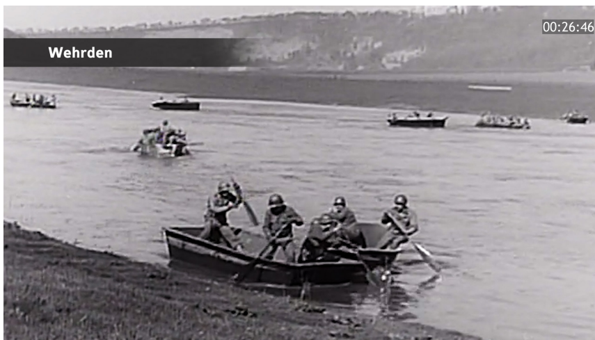
Amerikanische Weserüberquerung in Boten zwischen Wehrden und Fürstenberg.

Im Mittelpunkt stehen die militärisch aussichtslose deutsche Verteidigung an der Weser, Durchhalteparolen des nationalsozialistischen Regimes, der Einsatz von Hitlerjugend und Volkssturm sowie Unterschiede zwischen Wehrmacht- und SS-Einheiten, deren teils fanatischer Widerstand die Kämpfe in den Dörfern verschärfte. Der Film schildert auch Gewalt des Regimes gegen die eigene Bevölkerung und die Sprengung sämtlicher Weserbrücken trotz Protesten der Zivilbevölkerung.